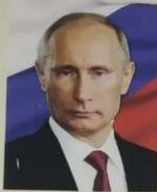
Президент РФ Путин В.В.